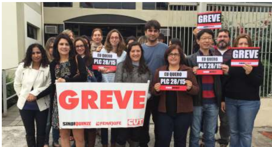
Servidores da Justiça do Trabalho em Sorocaba também estão mobilizados: descontentamento pela falta de PCS, que achatou os salários nos últimos anos