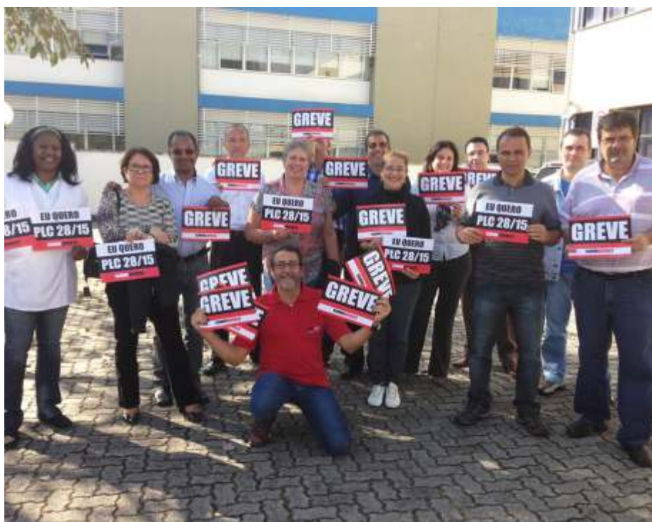
Servidores de São José dos Campos também participam da mobilização pelo PLC 28/15: força e unidade da categoria rumo à paralisação na Justiça do Trabalho