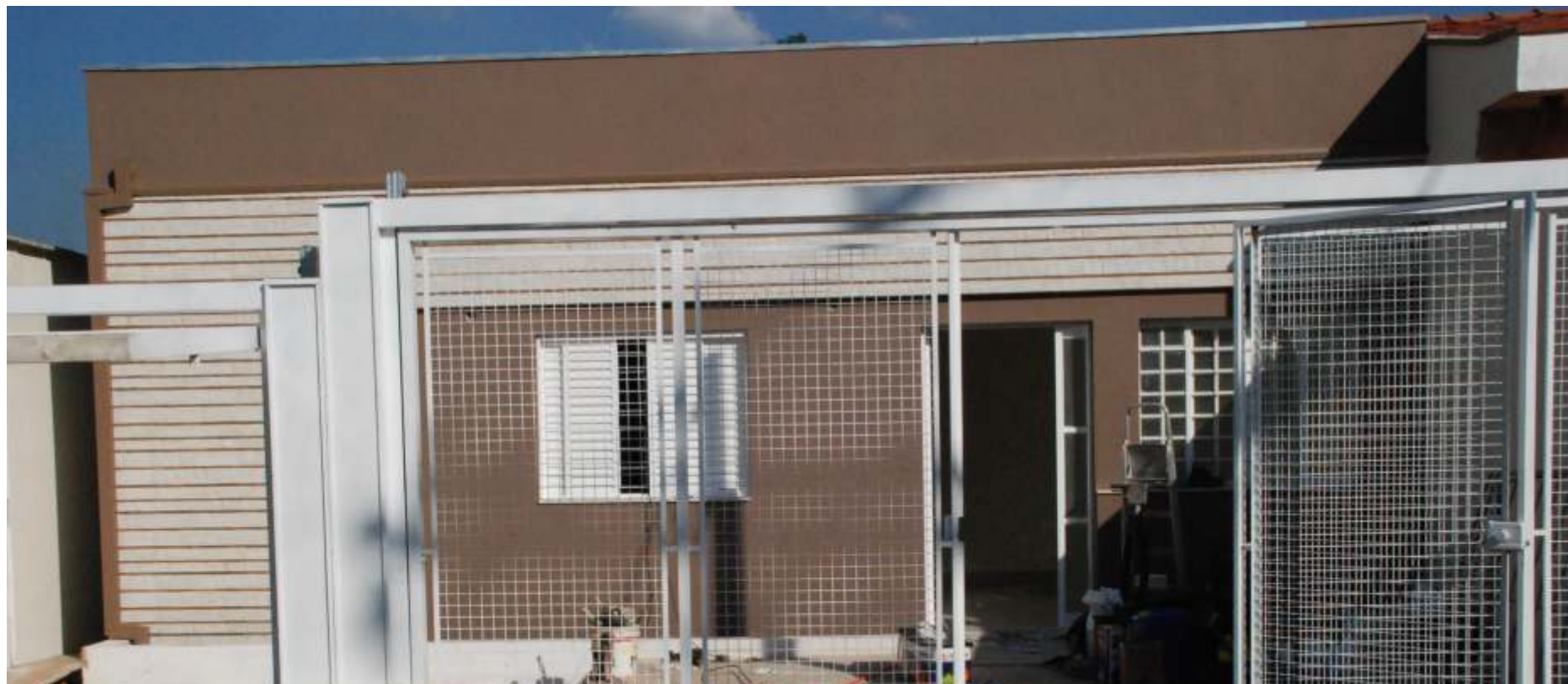
Suítes Taquaral recebe os últimos retoques antes da inauguração: equipamento de alta qualidade para o conforto do associado