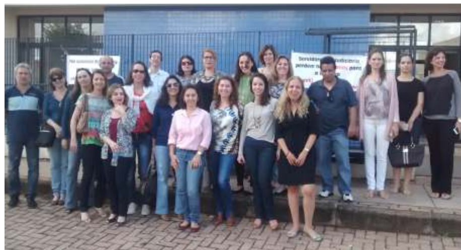
Servidores de Ribeirão Preto em mobilização pela campanha salarial: reajuste só virá com grande adesão dos servidores à paralisação nacional