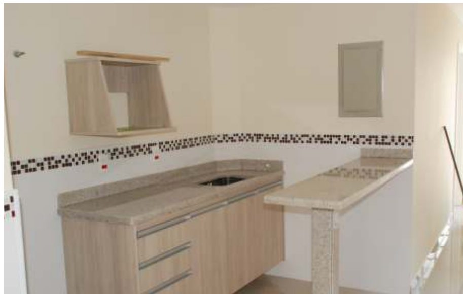
A cozinha do alojamento com padrão de hotel em breve será equipada: hóspedes poderão fazer pequenas refeições

Além de atender servidores que vêm a Campinas para cursos e eventos do TRT, além de atividades do sindicato, o alojamento também estará disponível para o associado que quiser vir a Campinas para tratar assuntos particulares, inclusive aos finais de semana.